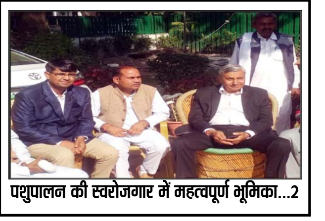
पशुपालन की स्वरोजगार में महत्वपूर्ण भूमिका...2